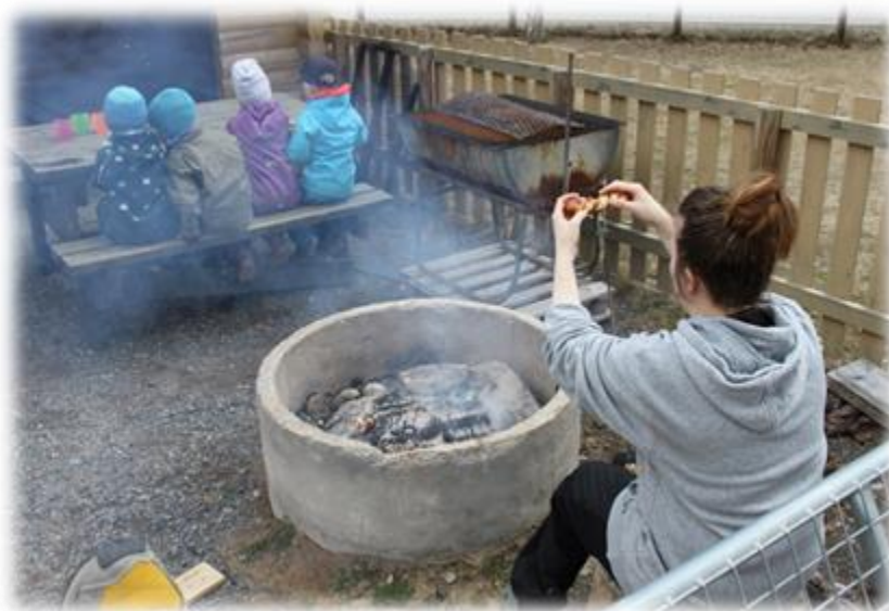
Pinnebrød i gapahuken